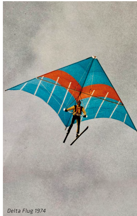
Delta Flug 1974